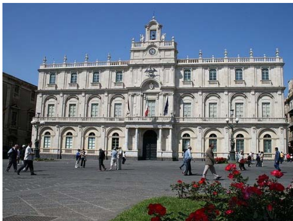
Palazzo Centrale dell'Università Sede del Rettorato

Per motivi organizzativi, si prega di essere puntuali.